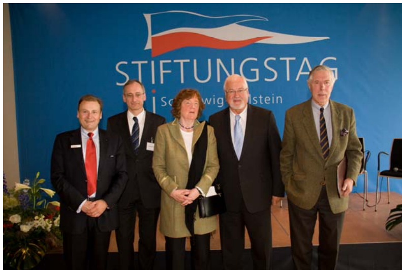
Eröffnung des Stiftungstages in Kiel mit Ministerpräsident Carstensen

Im Mai fand in Kiel der Schleswig-Holsteiner Stiftungstag statt. Die Organisation lag bei uns. Ministerpräsident Peter Harry Carstensen: „Stifter sind Vorbilder für uns alle, denn sie folgen nicht nur ihren persönlichen Interessen. Die Bürgerstiftung hat in den vergangenen Jahren Freunde gewonnen, ermöglicht sie es doch vielen Menschen gleichzeitig mit einem überschaubaren finanziellen Betrag in ihrer Gemeinde oder Region etwas Gutes zu tun.“