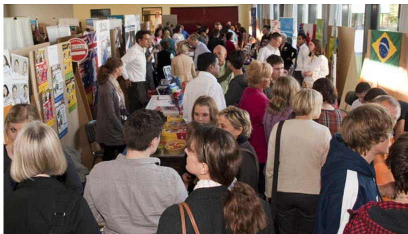
Blick in die Ausstellung im Ganztagszentrum in Bargteheide