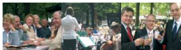
Ahrensburg: Gute Stimmung beim größten Frühstück in Schleswig-Holstein zu Gunsten kranker Kinder.

1.000 Bürgerinnen und Bürger frühstückten im Sommer 2007 bei bestem Sommerwetter in Ahrensburg gemeinsam für einen guten Zweck. Die Spenden kamen schwerstbehinderten Kindern zugute.