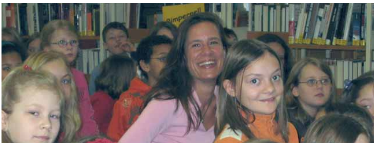
Isabel Abedi, bekannte Jugendbuch-Autorin aus Hamburg, kam auf Einladung der Bürgerstiftung zum Welttag des Buches nach Ahrensburg. Die Ahrensburger Stadtbücherei war bis auf den letzten Platz belegt, weil so viele Kinder und Eltern Isabel Abedi live erleben wollten.

„Was mich besonders an der Vorleseaktion erfreut, sind das „Hallo“ und die erwartungsvollen Gesichter, wenn ich zum Vorlesen in den Kindergarten komme.“