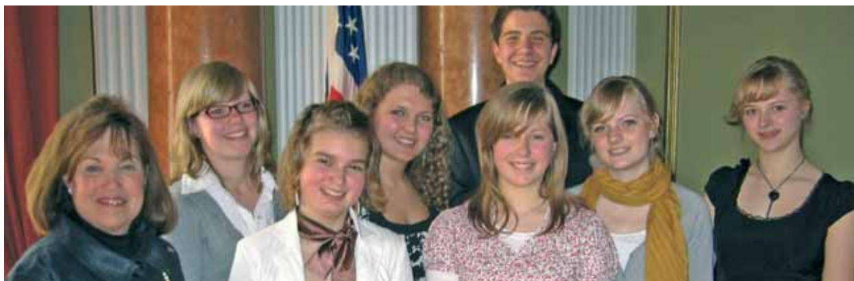
Die Verleihung der Stipendien durch US-Generalkonsulin Karen E. Johnson im Generalkonsulat Hamburg

Zusätzlich organisieren wir jährlich eine Stipendien-Ausschreibung für ehrenamtlich aktive Schüler mit einer festlichen Stipendien-Verleihung.