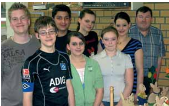
Schüler der Heimgartenschule zeigen Werkstücke