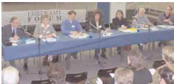
Stormarner EhrenamtForum in Ahrensburg